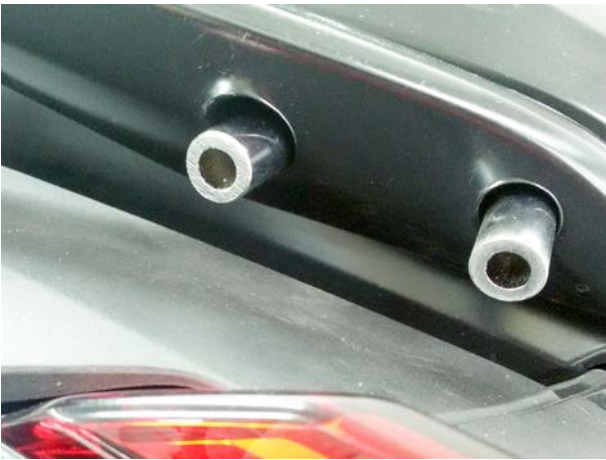
Mounting pic 1