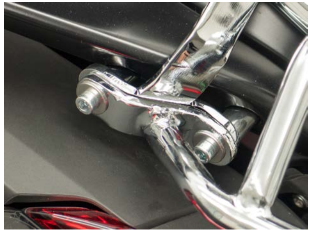
Mounting pic 1A