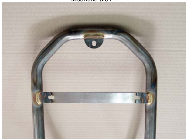
Mounting pic pad fastening